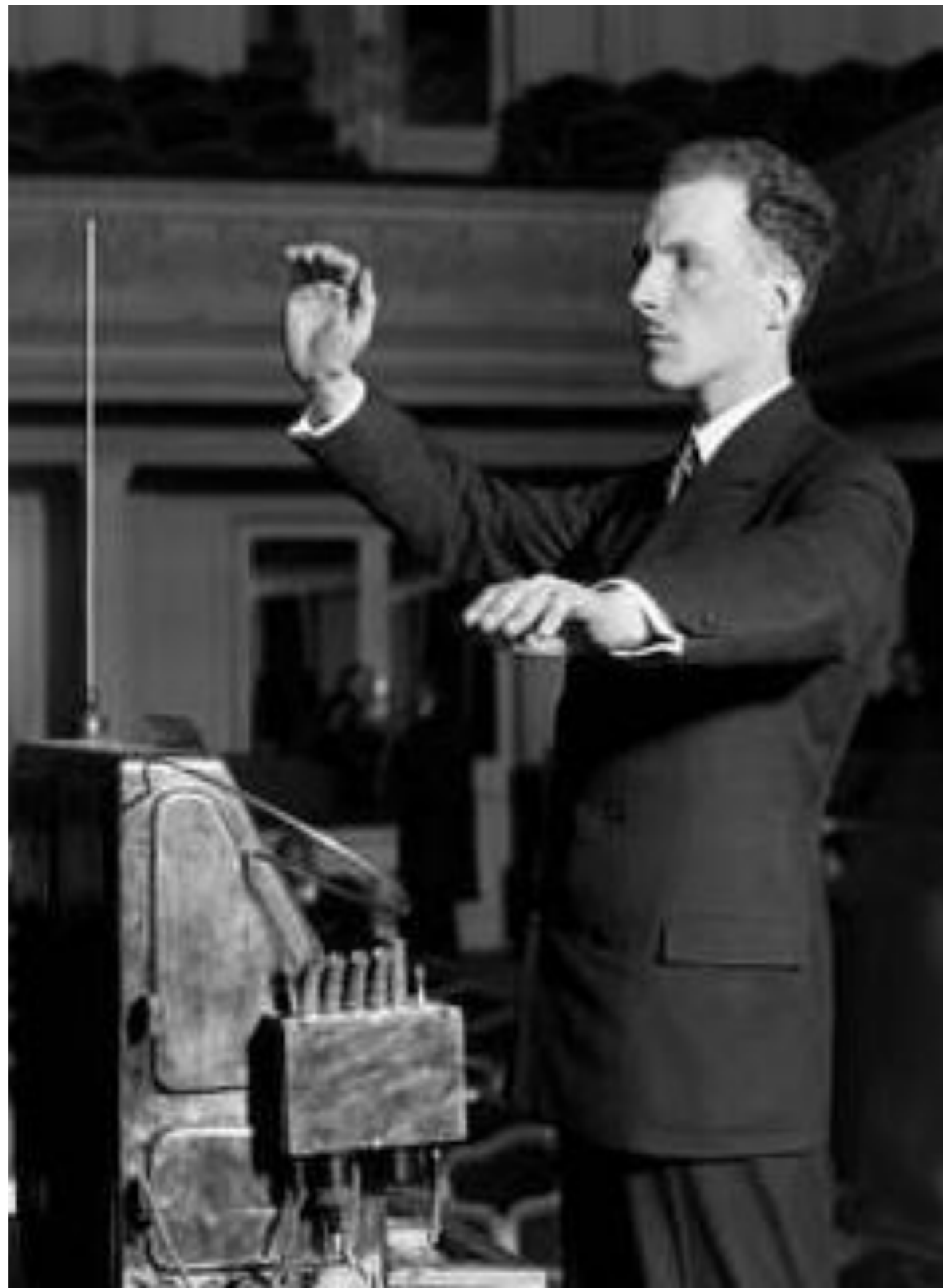
FIGURA 1 – Léon Theremin 1927 tocando sua criação

O Theremin é um instrumento musical criado na década de 1920 pelo físico russo Lev Sergeyevich Termen, conhecido nos Estados Unidos da América como Léon Theremin [1]. Esse instrumento é composto por circuitos eletrônicos, responsáveis por gerar sinais elétricos convertidos para um alto-falante. Não há contato físico entre o instrumentista e o Theremin. O instrumento é controlado pela proximidade das mãos que altera a frequência e volume do som [1]. A foto do primeiro Theremin e de seu inventor estão ilustradas na Figura 1.